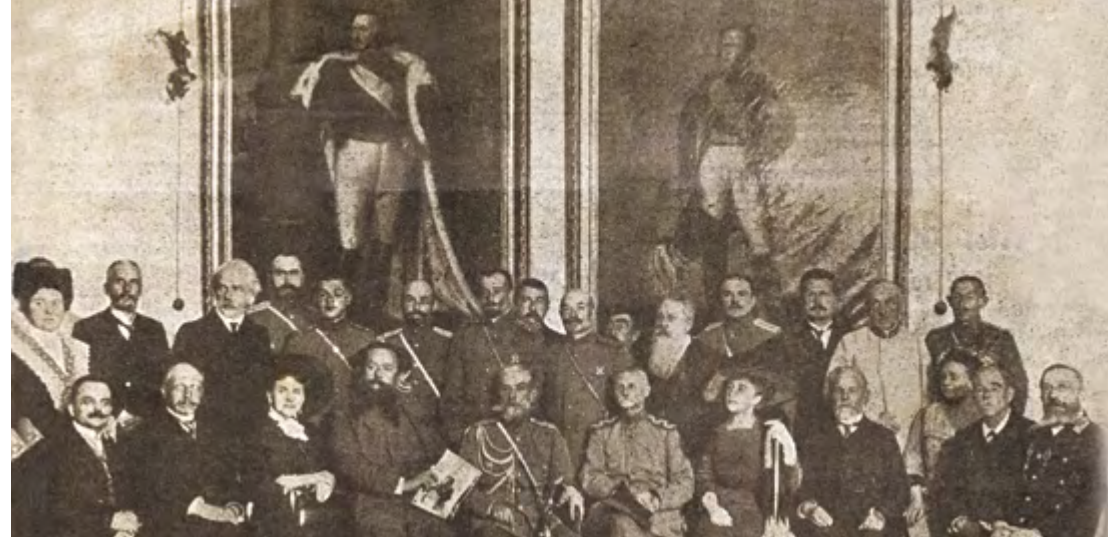
Члены Кружка ревнителей памяти Отечественной войны 1812 г.