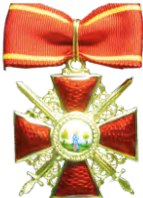
Знак ордена Св. Анны 2-й степени