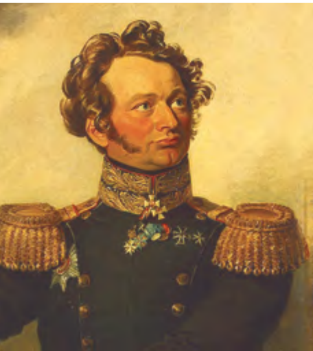
Карл Иванович фон Бистром.

Самой популярной фигурой из всех Бистромов можно с полным правом назвать Карла Хейнриха ( Карла Ивановича фон Бистрома ). Он участвовал в наполеоновских войнах с 1805 г. К началу Отечественной войны он имел чин полковника и командовал лейб-гвардии Егерским полком. Участвовал в Смоленском и Бородинском сражениях (за последнее произведен в генерал-майоры). Командуя егерской бригадой при Красном, он взял девять французских орудий, два знамени и жезл маршала Даву. В 1813 г.