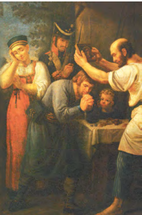
Благословение ополченца 1812 года. И.В. Лужанинов, 1812

дино офицеров Московского ополчения. Вдобавок ко всему после Малоярославца Лебедев совсем расхворался, уехал из армии в Калугу, где и умер 25 декабря 1812 г. В результате даже раненные при Бородино бельские ополченцы так и остались без награды.