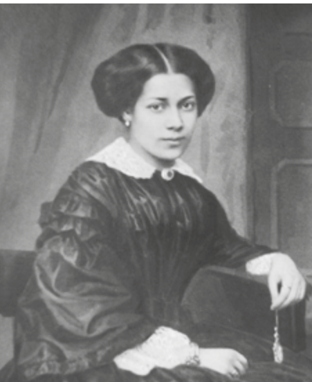
Ольга Сократовна – жена революционера Н.Г. Чернышевского

За 200 лет у генерала появилось восемь поколений потомков: 6 детей, 17 внуков, 13 правнуков. После двух сыновей фамилию никто не унаследовал. После 13-ти правнуков – чиновников и помещиков, попавших в условия Гражданской войны и репрессий – численность в поколениях резко сократилась и с четвертого по восьмое поколения составила соответственно всего лишь 5, 4, 6, 5 и 4 человека.