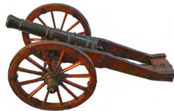
Сигнальная пушка из усадьбы Надеждино. Экспозиция Дмитровского музейно-выставочного комплекса